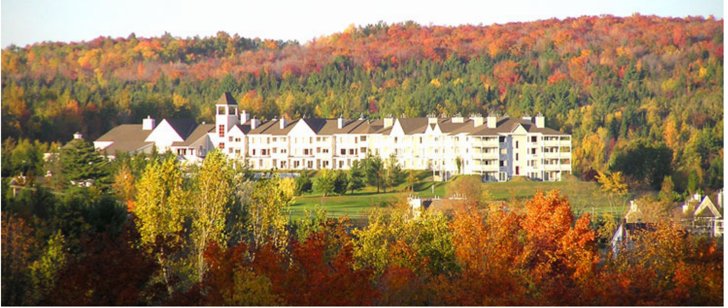
Manoir des Sables

Avec quatre hôtels au Québec, le groupe Villegia vous propose un séjour sur mesure. Ils sont localisés dans trois régions différentes : le Manoir des Sables et l' Hôtel Chéribourg , Cantons-de-l'Est, l' Hôtel Le Victorin , Centre-du-Québec et le Manoir St-Castin , Région de Québec. Tous classifiés quatre étoiles, ils vous offrent confort, gastronomie et une pléiade d'activités. Vous avez vraiment l'embaras du choix!