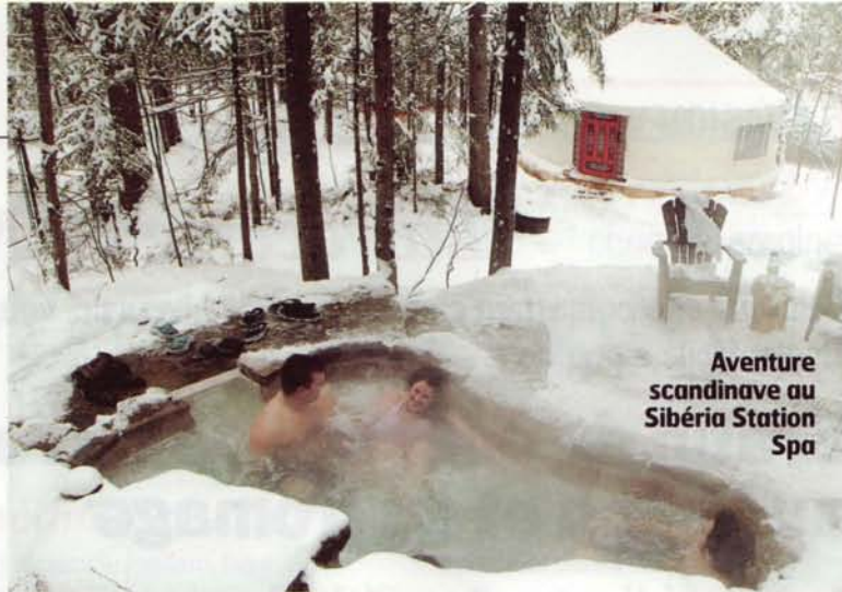
Aventure scandinave au Sibéria Station Spa