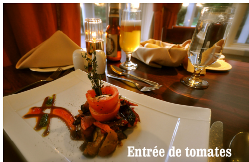
Entrée de tomates