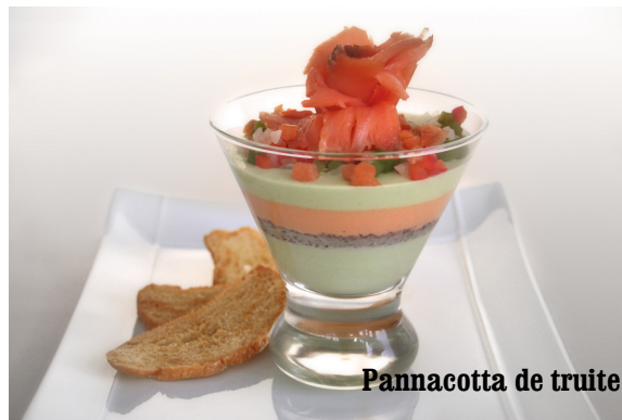
Pannacotta de truite