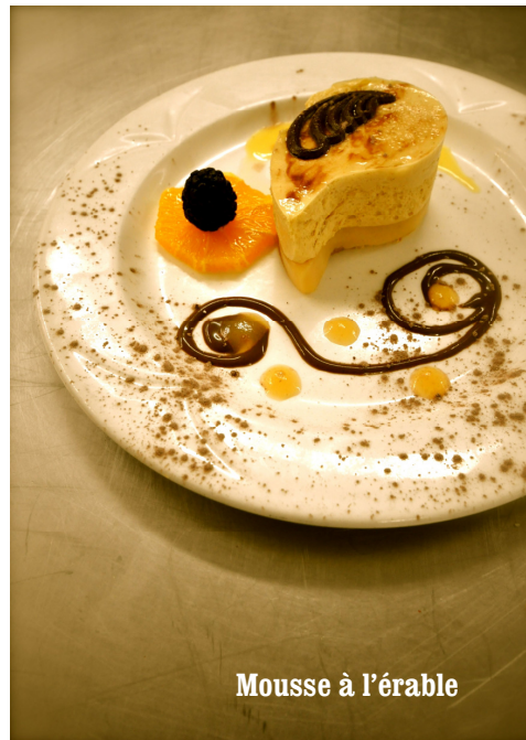
Mousse à l'érable